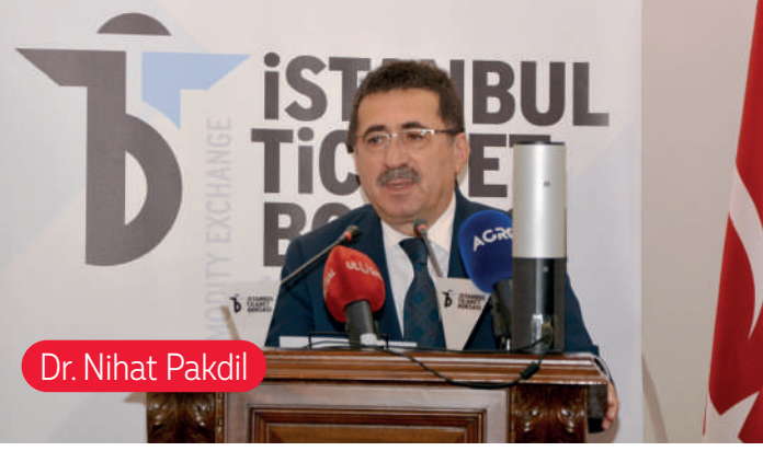
Dr. Nihat Pakdil

destekleri devam edecek. Bu zamana kadar 4 milyar TL'yi aşmış bir destek sağladık. 2022 yılında ithalat ve ihracat gerçekleşmesi yüzde 31'deyken, bu yıl bu rakam %137'de. Cumhuriyet tarihi rekorunu kırdık. İslahçı haklarında şu ana kadar 3 bin 131 başvuru alındı ve bunlardan 2 bin 243 bitki çeşidi koruma altına alındı. Bu koruma altına alınan bitkilerin %50'si yerli ıslahçılar tarafından geliştirildi. Gelişen teknolojiyi kullanacağız. Yerimizde durmayacağız." ifadelerini kullandı.